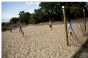
Espace sportif et ludique avec terrains de beach-soccer, -volley et -tennis