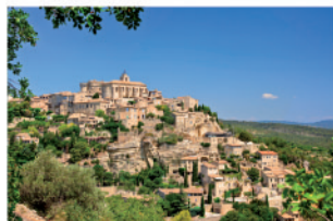
A moins de 20 km de villages classés et renommés : Gordes, Roussillon...