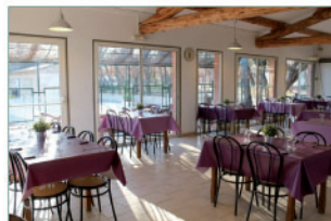
Espace restauration convivial et familial