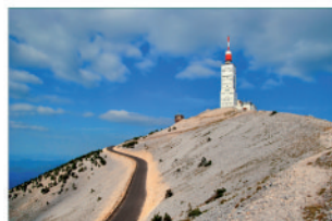
Au départ de randonnées cyclistes au coeur du Luberon et avec le Mont Ventoux en point de mire