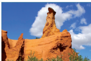
A 15 min du Colorado Provençal et ses randonnées pédestres magiques