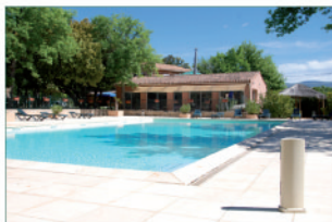
Piscine de plein pied de 200 m 2 , avec pataugeoire