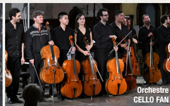
Orchestre CELLO FAN