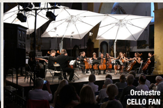
Orchestre CELLO FAN